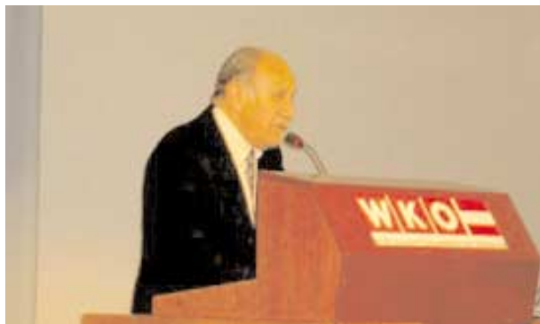
Paul Singer während seines Vortrags am 36. Lateinamerika-Tag in der Wirtschaftskammer Österreich.

Paul Singer é Secretário Nacional de Economia Solidária no Ministério do Trabalho do Brasil