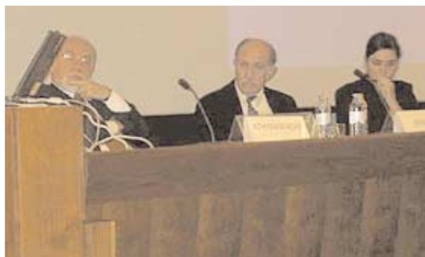
Paul Singer am Podium. Paul Singer no pódio.