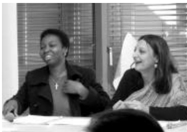
Kommunikation, Austausch und Spaß beim Osterseminar.

Die Frage der Reintegration spielt vor allem im Hinblick auf die individuelle Betreuung eine Rolle: sowohl hier in Österreich, als auch nach der Heimkehr. Der Kontakt zu den ehemaligen StipendiatInnen bleibt in den meisten Fällen erhalten und wird v.a. via E-Mail gepflegt.