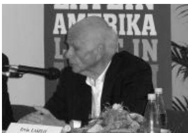
Ervin Lazlo bei seinem Vortrag über Ethik und Globalisierung in Bratislava.

internationales Seminar Ende April 2006 in Wien kurz vor dem EU-LAC Gipfel.