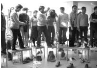
„Wirtschaft und Armut“ war das Thema in Passau.

Das alljährliche Osterseminar für StipendiatInnen der EZA und interessierte Studierende wurde auch im vergangenen Jahr wieder gemeinsam mit dem AAI Wien, Salzburg und Graz sowie mit der Österreichischen Orient Gesellschaft Hammer-Purgstall und dem ÖAD zum Thema „Wirtschaft und Armut“ organisiert und in Passau durchgeführt.