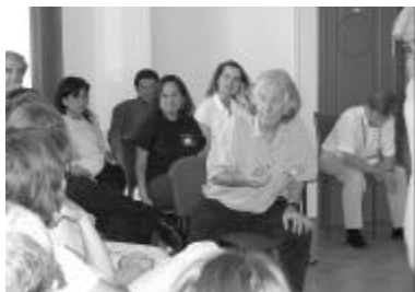
Augusto Boal beim REAL-Workshop in Bratislava im Juni 2005.

Im Frühjahr 2006 fand im Rahmen der österreichischen EU-Präsidentschaft in Wien der EU-Lateinamerikagipfel mit Regierungsdelegationen aus rund 60 Ländern statt. Im Vorfeld dieses Ereignisses organisierten das Österreichische Lateinamerika-Institut (LAI) und die Austrian Development Agency (ADA) drei regionale Workshops, den ersten davon Anfang März in Buenos Aires. Weitere Workshops, bei denen die Themen Armut, Entwicklung und Demokratie im Brennpunkt standen, fanden im Juni in Bratislava und im September in Granada/Nicaragua statt. Den Abschluss bildet ein