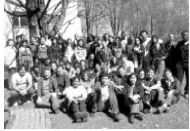
Die TeilnehmerInnen des Osterseminars 2006 in Passau.

Integration und interkultureller Austausch sind die Hauptziele der Veranstaltungen im Rahmen der studienbegleitenden Bildung. Wichtig sind dabei die in Zusammenarbeit mit den anderen Stipendienorganisationen veranstalteten Aktivitäten.