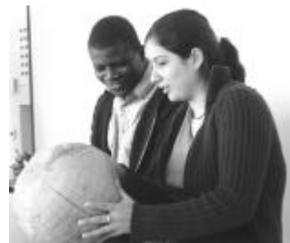
Gemeinsamer Blick auf die Welt.