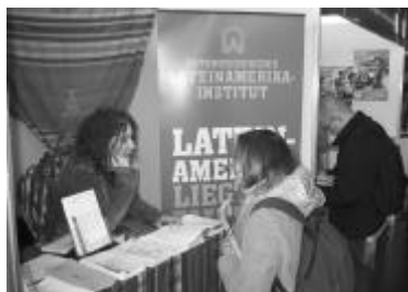
Beratung und Information über das Bildungsangebot des LAI bei der „BeSt“ 2005.

Erstmals nahm das LAI im März 2005 an der „BeSt“, der Messe für Beruf, Studium und Weiterbildung in der Wiener Stadthalle teil. Wir nutzten die Gelegenheit, einem jungen und interessierten Publikum unser Sprachkursangebot und den Lateinamerika-Lehrgang zu präsentieren.